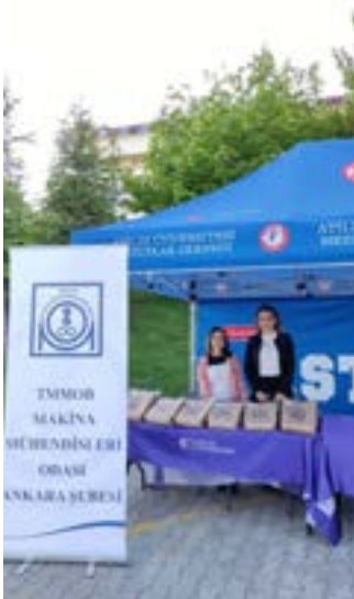
Atılım Üniversitesi 24.06.2022

Törenlerde, üniversitelerin Odamızın faaliyet alanlarını kapsayan bölümlerinde ilk üçe giren öğrencilere, Şube Yönetim Kurulumuz adına plaket ve çeşitli hediyeler verildi. Şube teknik görevlilerimiz tarafından öğrencilere Odamız ve Şube çalışmaları hakkında bilgi verildi.