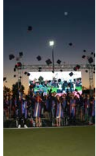
TED Üniversitesi 26.06.2022