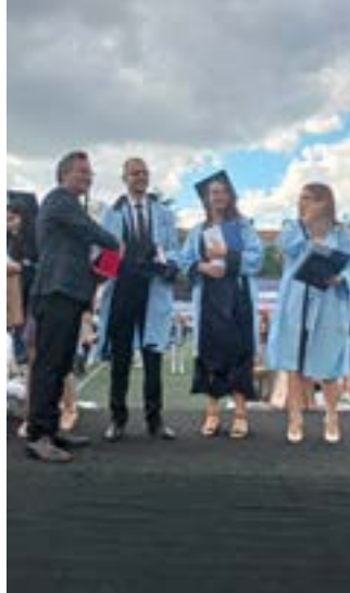
Gazi Üniversitesi 25.06.2022